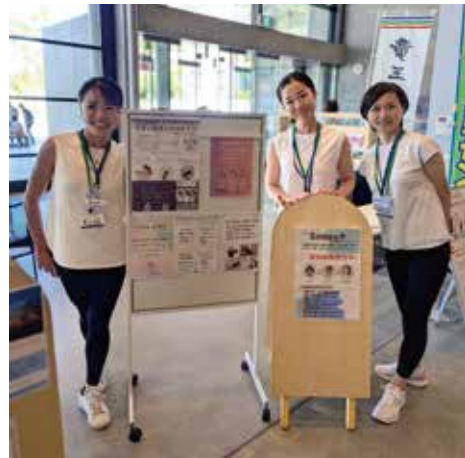
Sintex® 背骨の調律エクササイズ