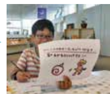
自分だけの「おにクルツアー」作成