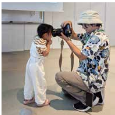
スマホでも子どもを素敵に撮影するテクニック