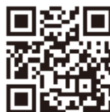
「ダムパークいばきた」 公式 HP

「ダムパークいばきたコミュニティ」が中心となって、フェスティバルの企画から運営、プログラムまで実施。「はじめまして！ヤマとまちをつなぐ」をテーマにマルシェや茨木市の資源を活かした体験プログラムが多数あるようです。