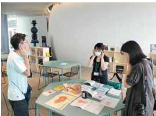
いやあ (EAR) 耳ってふしぎ