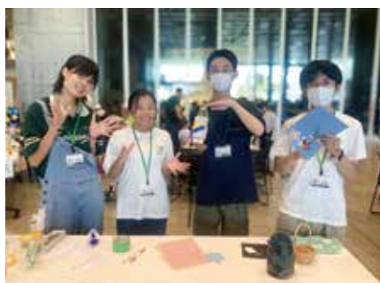
星を目指すロケットを作ろう！

はじめてのイベント企画にチャレンジする『はじめてチャレンジ企画』。応募からイベント実施まで約3カ月をかけて、企画の立案、チラシ作成、参加者募集までを行い、8月は7つの企画が実施されました。高校生や大学生も初めてのイベント企画にチャレンジし、それぞれの思いが形になった1日となりました。