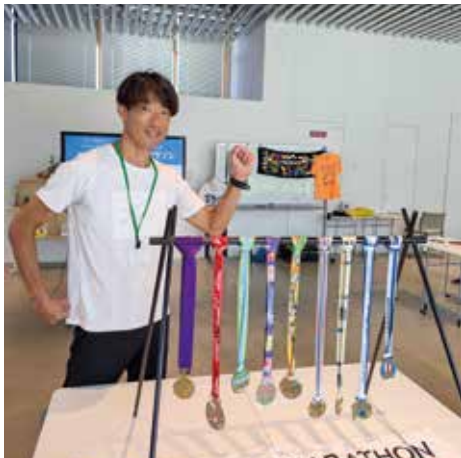
挑戦してみよう！フルマラソン