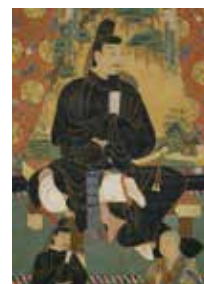
藤原鎌足像 室町時代 奈良国立博物館所蔵

一部茨木市にかかる“阿武山古墳”の謎と、そこに埋葬されていると言われている鎌足の生涯について。