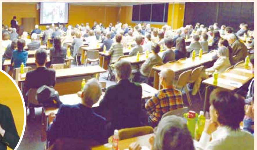
「市民活動センターのあゆみ」のパワーポイント